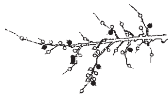
5頂芽に1果（着果数は8果）