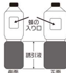
図1 ペットボトルを利用したスズメバチ捕獲器

ウ. スズメバチ等が入った誘引液は腐敗が進むので1週間程度で交換し、ボトル内部の死骸を処分する。スズメバチが多量に入った場合、後から入ったスズメバチが溺死しないので、誘引量に注意して早めに液を交換する。誘引液の交換の際、ボトル内部に生きたスズメバチがいる場合は、市販のスズメバチ用殺虫スプレーを噴射し、スズメバチが死んでから液を交換する。