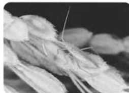
アカヒゲホリソドリカスミカメ

○高温年など登熟後期にカメムシ類の発生が多い場合は最終散布の7~10日後に追加防除を行う。