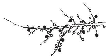
4頂芽に1果（着果数は10果）