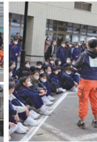
▲ 事故原因のルール違反を確認