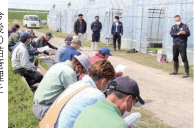
今後の苗管理を確認する部会員ら

はじめに講師の西北地域県民局の担当者は、2022年の気象と生育・収量調査結果について振り返りました。続いて、現在の管内の苗生育状況が順調であると述べ、地温が上がる前の灌水と、夜の低温と日中の高温に配慮した温度管理が重要と説明。「田植後の天候が不安定であっても負けないよう、伸ばしすぎに注意して強い苗を作る」と呼びかけました。