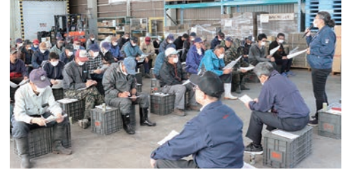
適期防除を目指し集まった共防連関係者ら

西北地域県民局の担当職員は、管内の気象状況から生育ステージについて説明。春先の風が強い時期の作業で、薬剤散布を心がけてほしいと呼びかけました。