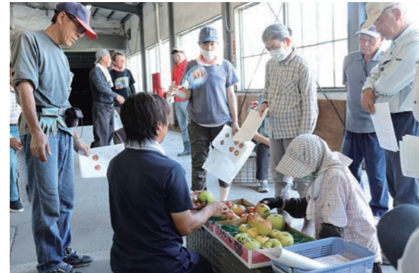
サンプルを見ながら出荷基準を確認する生産者ら

また、サビ果が多く見られることから、少しでも収入につなげようと、今年からは初めて「つがる」の缶詰を受入を決めました。