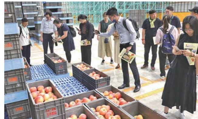
冷蔵庫の中でリンゴを撮影するバイヤーら