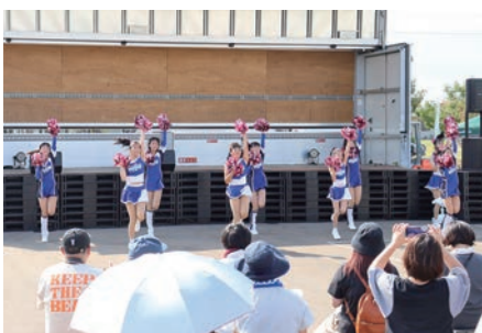
チアダンスチームのステージ

さらにチアダンスチーム「ブルリングス」ジュニアチーム弘前校のみなさんがキュートなパフォーマンスを披露。