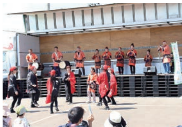
さかえ立佐武多の踊りと演奏

響き渡る弾むような鐘、笛、太鼓の音。聞きなじんだリズムに、会場は「じゃわめく」雰囲気になりました。