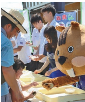
青森ワッツ選手らが餅振り

青年部員が揃いの法被をまとい、ステージ前で餅つきパフォーマンスを行いました。力強い姿に、「よいしょ！よいしょ！」と観客からの掛け声が上がると、会場が一体となって大盛り上がり。GMUメンバーや青森ワッツの選手も杵を握って餅つきに参戦！