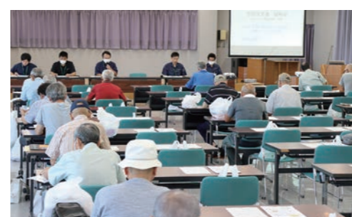
久々に開かれた説明会の様子

また、ドローンの資材の搭載も増えており、使用などについては相談してほしいと呼びかけました。