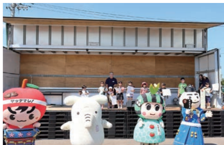
ゆるキャラと受賞者が記念撮影