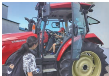
トラクターに乗り込む来場者

会場には大型農業用機械の展示スペースも用意。機械メーカーが来場者に対応し、試乗体験や小型機械の実演などを行いました。来場者は普段身近で見ることができない農業関連機械に心を示しました。