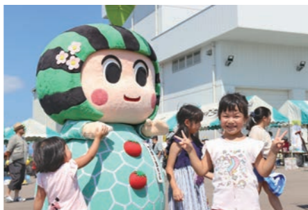
来場者がゆるキャラと記念撮影

イベントのため、地元のゆるキャラたちが駆けつけてくれました！子どもも大人も、ゆるキャラを見ると笑顔に。来場者を喜ばせました。