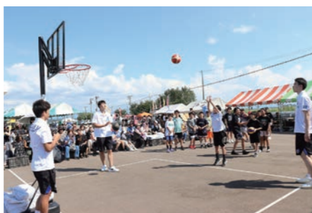
青森ワッツ選手が見守る中子どもたちのフリースロー対決

プロバスケットボールチーム「青森ワッツ」のメンバーが会場を盛り上げるために来場！選手とマスケットキャラクターのテッチたちはブリス紹介やフリースロー対決など来場者との交流を楽しみました。