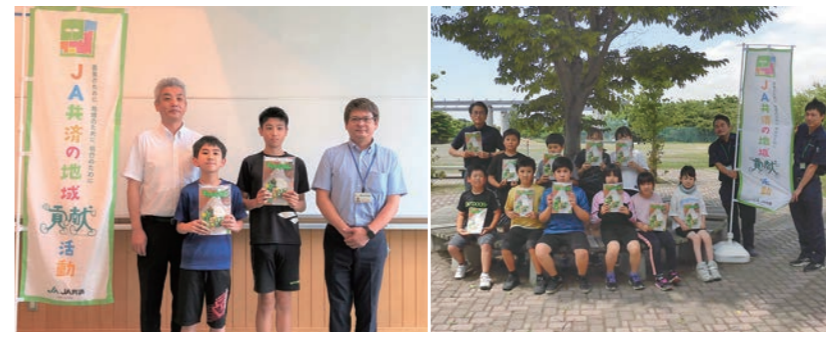
向陽小学校（つがる市）

「ちやぐりん」は食や農業について楽しい企画が満載で、遊びの要素を含みながら勉強が内なる内容となっています。