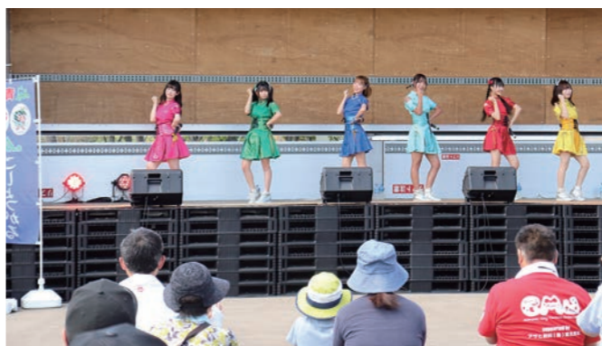
トラックとパレットでできたステージ上でライブ