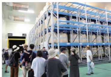
集出荷貯蔵施設見学の様子

イベント会場の敷地内にある「グローバルライス（精米施設）」「集出荷貯蔵施設」の見学ツアーを実施しました。25人の来場者が参加し、米の荷受け、精貯蔵、精米加工から流通までの流れに理解を深めました。