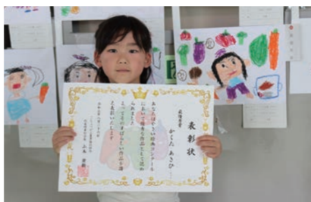
野菜がたくさん描かれた絵と一緒に