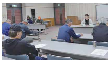
大豆刈取り講習会の様子

木造総合支店において大豆刈取り講習会を開催しました。部会員23人が参加し、収穫作業時の注意点や刈取時期について情報を共有しました。 講師の西北地域農政局地域農林水産部普及振興室の担当職員は「水分の高い茎葉が混入すると、その汁が大豆に付着し汚粒の原因となるため、成熟期になっても茎や葉が緑色のまま残っているものは、収穫前に抜き取りを徹底するように」と呼びかけました。