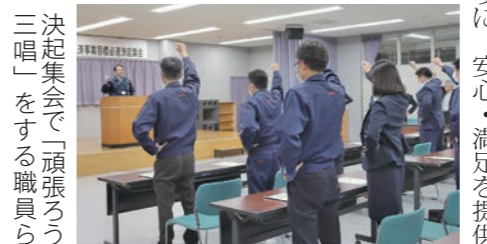
決起集会で「頑張ろう三唱」をする職員ら

本店で「2023年度共済事業目標必達決起集会」を開きました。JA共済連青森やJA役員、ライフアドバイザー(LA)、スマイルサポーターら41人が出席し「ひと・いえ・くるま・農業」の総合保障の提供を通じ、組合員や利用者に安心な生活を届けていこうと決意を新たにしました。