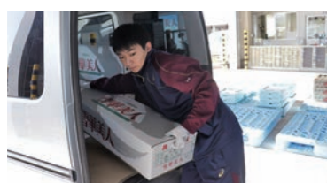
花の荷受け作業を行う インターンシップ生

学校法人下山学園五所川原商業高等学校2年生2人のインターンシップを受け入れました。2人は3日間で米穀課、りんご野菜課、購買課、企画管理課をまわり、それぞれの業務を体験。 そのうち野菜予冷センターでは、生産者が出荷してきた野菜や花を車から降ろし、段ボールの向きや置き方に気を付けながら荷受け作業を手伝いました。時折生産者からも声をかけられ、受け答える姿が見られました。