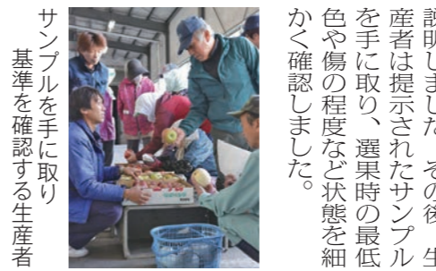
サンプルを手に取り基準を確認する生産者

管内14カ所で主力の「ふじ」を中心としたリンゴ晩生種の規格基準説明会を開きました。23日、五所川原市七和地区で行われた説明会には生産者およそ40人が参加しました。