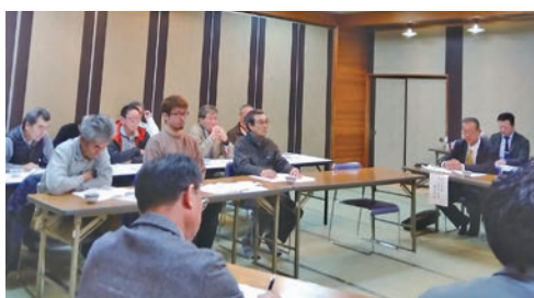
花き部会通常総会の様子

部会員からは部会運営に対する要望、意見もあられ、24年産の作付けに向け決意を新たにしました。