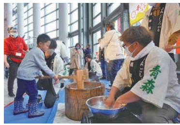
来館者と一緒にもちつきを楽しむ青年部員ら

来館した子どもも、青年部のサポートを受けながらももちつきに挑戦。つきあがった餅は、その場ですぐにおしるこにして振舞われ、来館者に喜ばれていました。