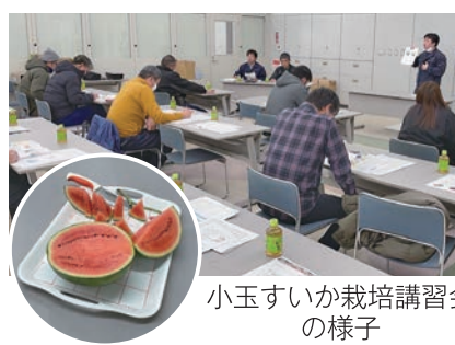
小玉すいか栽培講習会の様子

その後国内最小の小玉サイズ、新品種「ぶちっと」が紹介され、参加した生産者は実際に試食をし、種の小ささや食感、食味を確認しました。