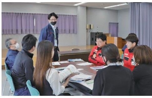
共済事業に関する疑問や意見を話し合う職員

研修会では、5人ほどのグループにL A（ライフアドバイザー）が配置され、各自加入している自動車共済の証書を見ながら補償内容を確認したり、どんな時に共済金が受け取れるかを質問したりするほか、こんな共済があったらいいなど自由に意見交換し、共済事業への理解を深めました。