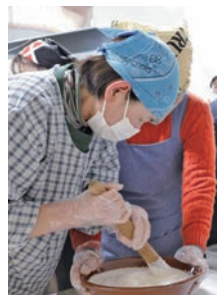
丁寧に大豆をする参加者

豆汁の他に、大福、おにぎりも作り、持ち寄った漬物とともに全員で試食しました。参加者の中には、豆汁を初めて作る人も多く、その美味しさに驚いていました。