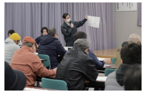
「青天の霹靂」栽培講習会の様子

「はれわたりの」と「青天の霹靂」の栽培講習会を開催しました。それぞれ県民局の担当者を講師に迎え、栽培の要点について学びました。共通して、2023年産種子は、登熟期間が高温で経過したため休眠が深い可能性があり、浸種・催芽の温度管理を丁寧に行うようにとの説明がありました。管内では、はれわたりで91人120鉢、青天の霹靂で130人171鉢を栽培する予定です。