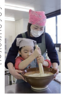
ふわふわになるように大豆をする親子

地元食材を使用した食農教育の一環として今回初めて親子料理教室を開催し、管内に住む親子8組20人が参加しました。料理教室では、管内で栽培された大豆「おおすず」、お米「はれわたりの」、リンゴ「ふじ」を使用し、伝統料理の豆汁と、梅干しとチーズを混ぜ合わせたおにぎり、りんご餡を調理しました。講師にJA女性部員4人を迎え、参加者との交流も楽しみながら調理を進めていきました。ほとんどの参加者が今回初めて豆汁を食べました。参加した母親は「子どもも食べやすく、家でも取り入れられそう。」と話しました。