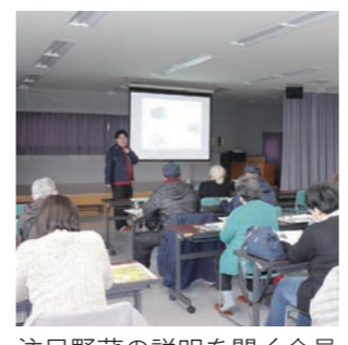
注目野菜の説明を聞く会員

まるっと新鮮館の会員を対象に、改正食品衛生法と食品表示に関して、直売所向け注目野菜の品種についての講習会を開催しました。食品関連の研修については、五所川原保健所の担当者が講師を務め、食品衛生法の改正部分や食中毒予防の基礎知識を中心に学びました。また、食品表示について実際に直売所で使用しているラベルを見ながら、注意点を確認しました。参加した会員は「知らないことも多く、気をつけなければならぬと思った」と気を引き締めていました。