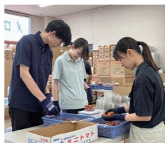
▲ミニトマトのバック詰め作業