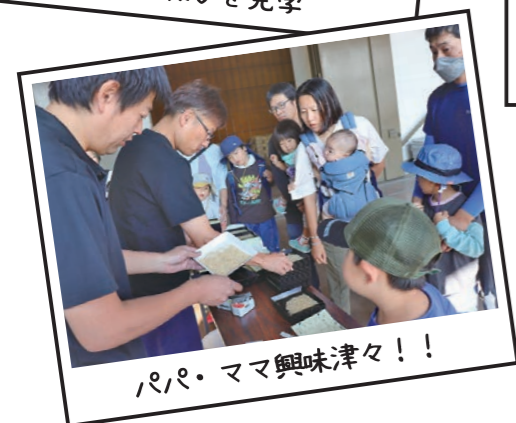
パパ・ママ興味津々！！