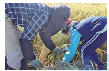
指導を受けながら手刈りをする児童

収穫した米は、児童らのイラストなどを書き込んだ袋に詰め、オリジナルの米として「まるっと新鮮館」での販売体験を行う予定となっています。