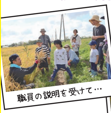
職員の説明を受けて…