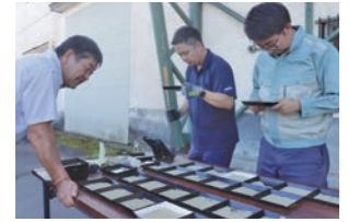
慎重に初検査をする農産物検査員

17日には同じく梅田10号倉庫で、米の程度統一会を実施しました。管内13カ所の米倉庫で検査を担当する職員らは、格付けの基準を確認し合い、24年産米の荷受け・検査が本格的にスタートしました。同時に、役員が一丸となって米集荷に臨む決意を新たにしました。