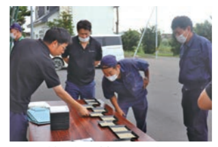
格付け基準を確認し合う職員