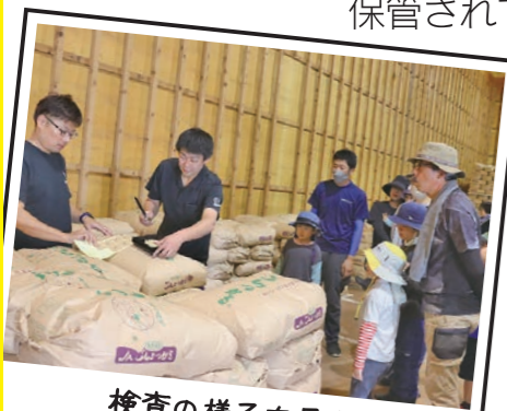
検査の様子を見学

イベントは倉庫見学からスタート！この日荷受けされたお米がどのように検査され、保管されているのかを見学しました。参加者は、次々と検査され等級が格付けされていくスピードに驚き、興味津々の様子でした。