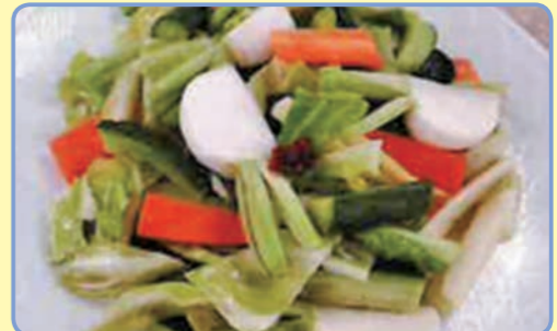
酸辣菜 (スアンラーツアイ、中華風酢の物)