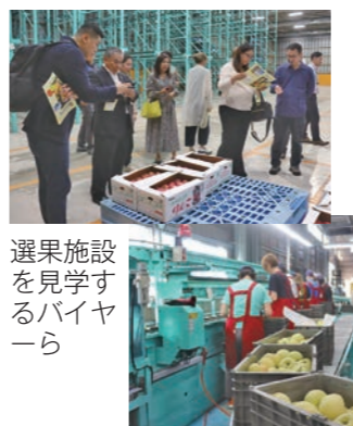
選果施設を見学するバイヤー

中央りんごセンターで、台湾バイヤーによる選果施設の視察を受けました。 青森県では25日、県内企業による台湾への販路開拓を支援するため、県内企業と台湾食品関連企業（バイヤー）による食品輸出商談会を開催しており、翌26日には、県職員や五所川原市職員と共に台湾バイヤー9人が中央りんごセンターを訪れ、リンゴの選果施設を見学しました。手渡されたパンフレットを見ながら通訳を介した説明を聞き、冷蔵庫内や選果の様子を見学していました。