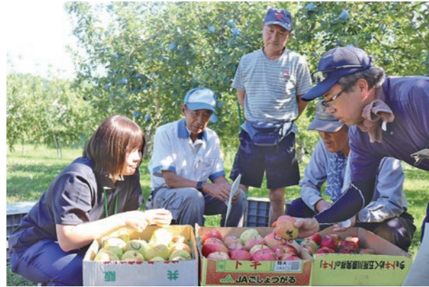
飯詰地区で開かれた規格基準説明会の様子

担当職員は「食味を重視し、熟度が進んでいるものからすぐりもぎをするように」と生産者らに呼びかけました。