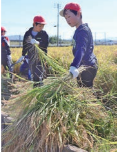
次々と刈り取った稲が積み上がっていく