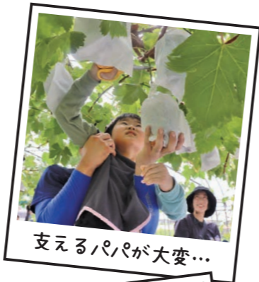
支えるパパが大変…