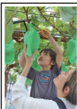
大きそうなものを選んで収穫

おまけのイベントとして、職員が研修用として栽培しているシャインマスカットの収穫体験を行いました。